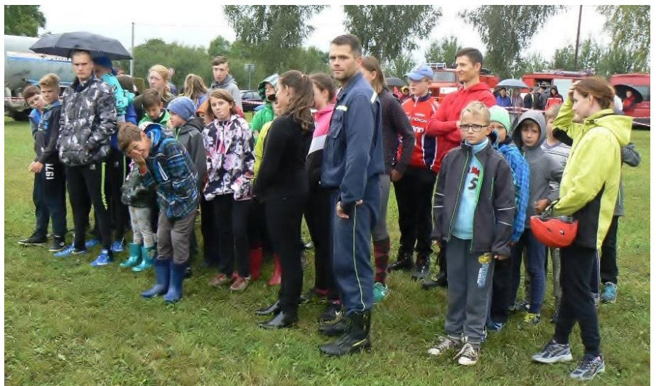
Soutěž v Sedlci