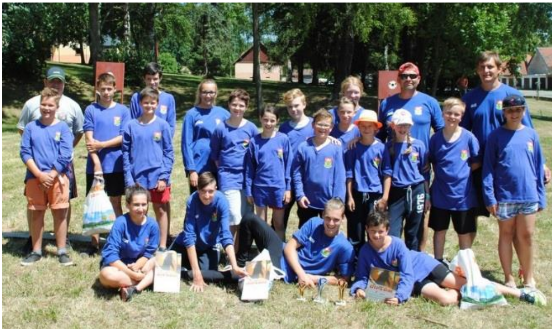
Soutěž v Trhových Svinech